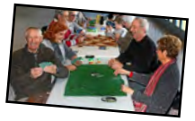
Table Jeux de Cartes Vous aimez jouer aux cartes mais vous êtes en manque de partenaire de jeu? Trouvez de nouveaux amis ici.

Table Marche & Nature Vous aimez marcher mais pas forcément seul(e)? Trouvez de nouvelles amitiés ici.